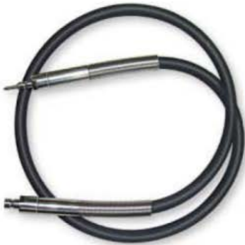
Code: ESD-369.306 Tige flexible pour l'unité d' entraînement