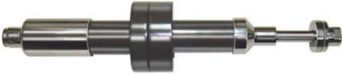
Code: ESD-369.305 Scie Pièce à main oscillant (Set de cinq lames)