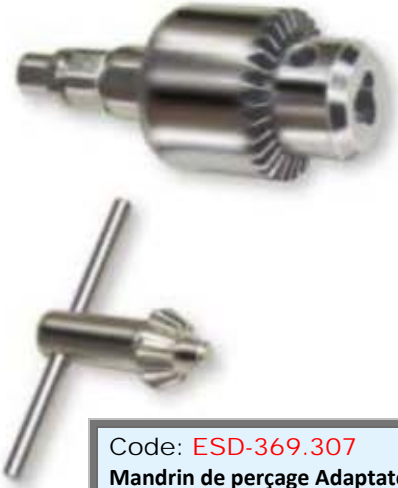
Code: ESD-369.307 Mandrin de perçage Adaptateur en acier inoxydable