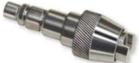
Code: ESD-369.309 Adapteur type Hudson en acier inoxydable