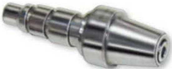
Code: ESD-369.308 Adapteur type AO en acier inoxydable